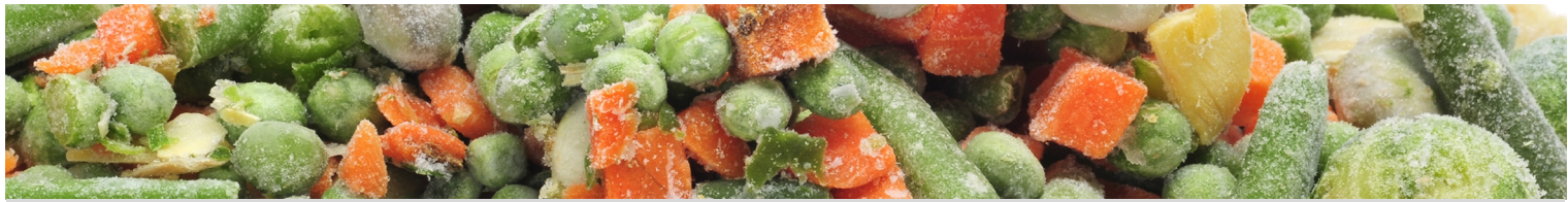
Table Top Fryser